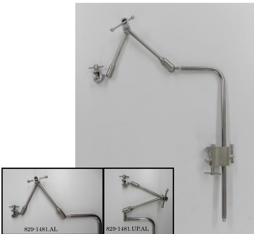
829-1481.AL 自在アーム ラージ L型バー 829-1481.UP.AL 自在アーム ラージ L型バー 上向き